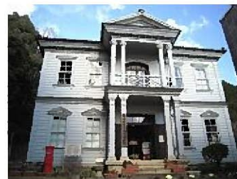
神崎郡歴史民俗資料館

ギリシャ建築様式を取り入れた西洋風建築物で、デザインはコリント風の彫刻を施すなど優れたものがあります。玄関部にバルコニーを持つなどの特徴を持ち、当地方の政治・行政的な中心施設でした。昭和57年に移築復元され、神崎郡歴史民俗資料館となりました。昭和62年には、兵庫県指定重要文化財となりました。