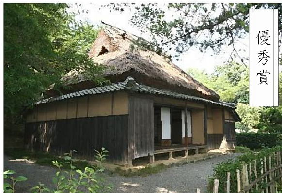
作品名：柳田國男生家