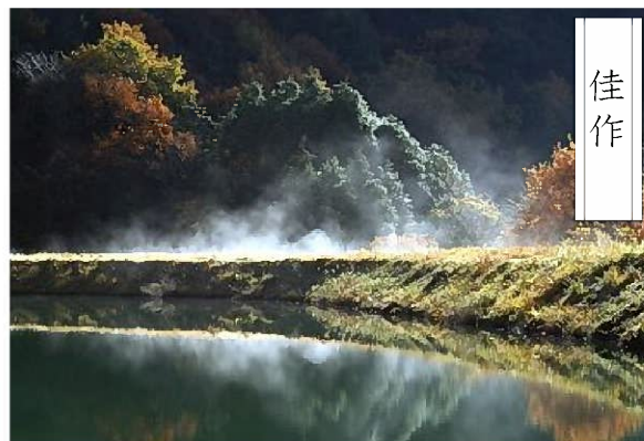
作品名：湖畔（田口奥池）

これらの写真を中心に福崎町の観光PRポスターを制作するなど、観光PRに活用させていただきます。