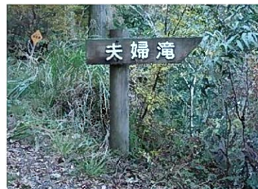
夫婦滝は、旧山門駐車場から鳥居前駐車場までの遊歩道沿いにあります。(写真)

リラックス効果があるといわれているマイナスイオンに包まれ、幸せ力をアップできそうなスポットです☆