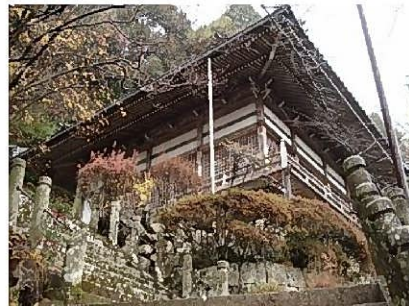
愛染明王座像は、金剛城寺本殿の右奥にある護摩堂(写真)内に収められています。

愛染明王座像は、護摩堂内に収められ公開されていませんが、創建1400年を超える金剛城寺を参拝すれば、良縁が期待できるかもしれません！