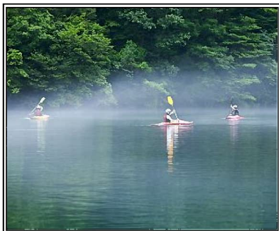
夏場にはカヌー教室も行われている。