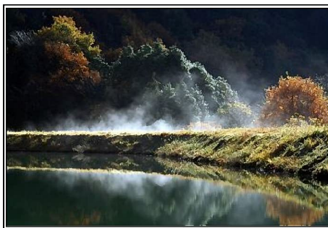
四季折々の風情を見せる田口奥池。その風景をカメラに収めるために訪れる人も多い。