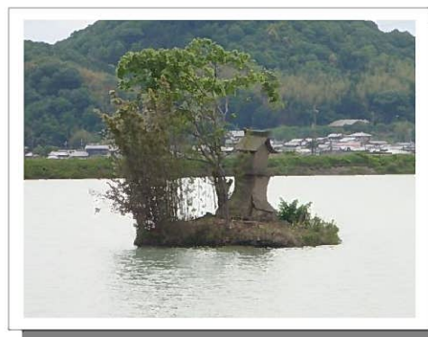
池の中央には弁天さん(弁財天)が祀られている。