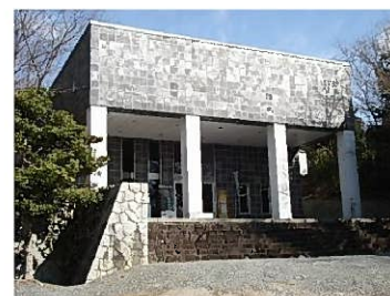
柳田國男・松岡家記念館