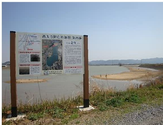
長池を含む西光寺野ため池群は、平成22年に『全国ため池百選』に選定されました。