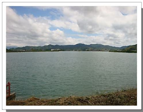
長池の全景。水量が少ない時期には、二つの池が統合されたことを偲ばせる浅瀬が現れる。