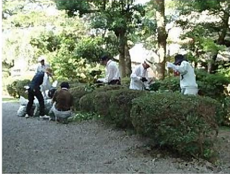
平成22年度クリーン作戦辻川地区の様子