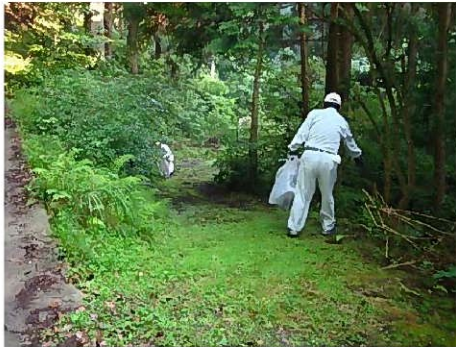
平成22年度クリーン作戦田口地区の様子