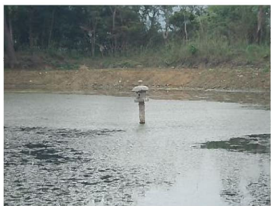
池の中央付近にある灯籠