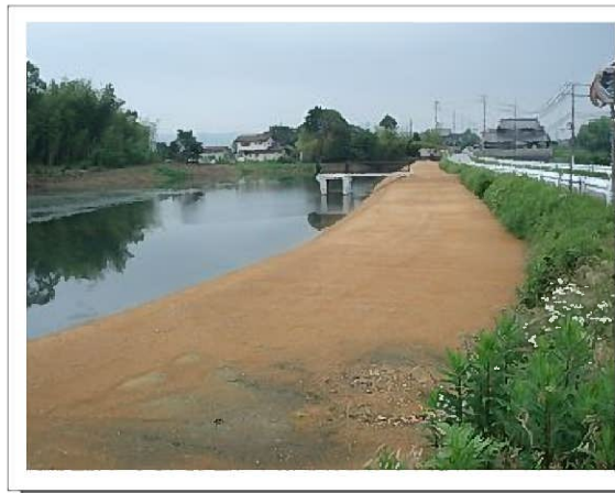
平成23年3月に新しい堤防が完成しました。