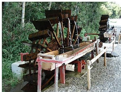
汲み上げられた水は水路を通して田畑へ