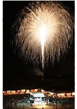
福崎夏まつり花火