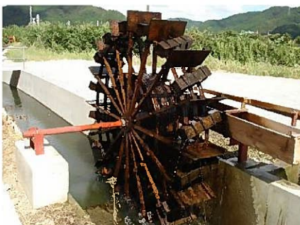
涼しげな音をたてながら回る水車

うだるような暑さが続く日々…。涼しさを求めて、ぜひ一度、山崎地区の水車を訪れてみてはいかがでしょうか。