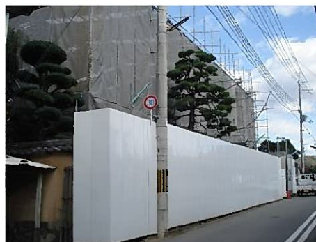
現在の大庄屋三木家住宅。 建物の南側は仮囲いで囲まれ、主屋全体が素屋根に覆われている。