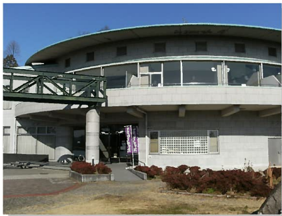
ふくさきふれあいの館 文珠荘