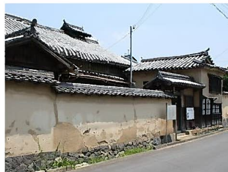
修理工事着工前の大庄屋三木家住宅

見学会の参加費は無料で、申込みも不要です。ぜひこの機会に、普段は見る事ができない貴重な文化財の修理工事の様子をご覧ください。