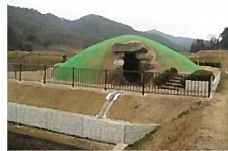
公園全景。駐車場も整備されている。