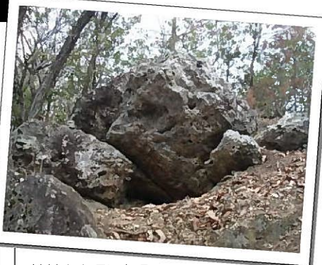
神前山山頂にある 磐座(いわくら)と思われる大きな岩