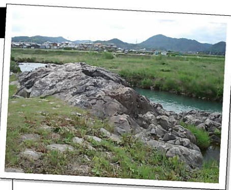
市川の川べりにある駒が岩