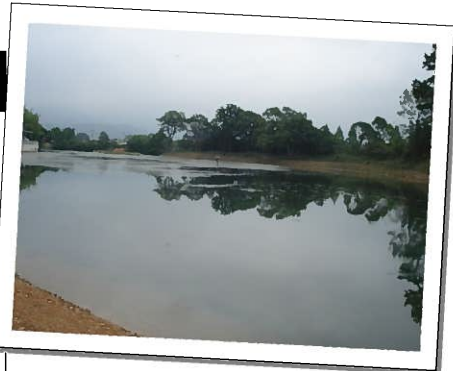
お姫様伝説が残る姫ヶ池