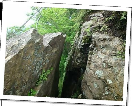
七種山の山頂付近にあるつなぎ岩（写真左） 上部は30～40cmほど隙間があいており、下部でつながっている。