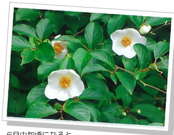
6月中旬頃になると 毎朝のように真っ白な沙羅の花が咲きます

朝咲いた花が夕方には散る…。沙羅の花は、まさに無常を示すたった一日だけの花です。