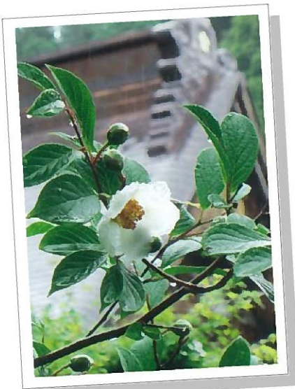
雨の中に咲く沙羅の花