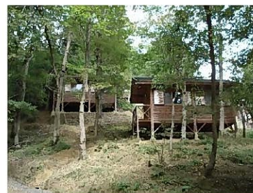
春日山キャンプ場

豊かな自然環境の中で気軽にアウトドアやスポーツ、農業体験などを楽しむことができる、レジャーに最適の施設です。