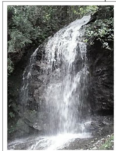
虹 ヶ 滝