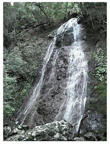
八 龍 滝

七種の滝は、県下百景、県観光百選、近畿観光百景に選ばれている名勝だよ。 雄滝は落差が72m、幅が3mあり、雨季には迫力のある滝を見ることができるよ！