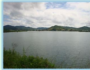
大きさは県下第3位を誇る