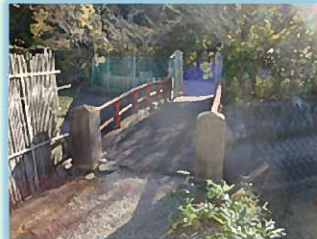
この橋を渡って弁天島へ