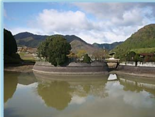
池の中央にある弁天島