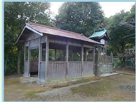
神谷前池の弁天さん