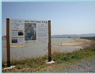
全国ため池百選の長池