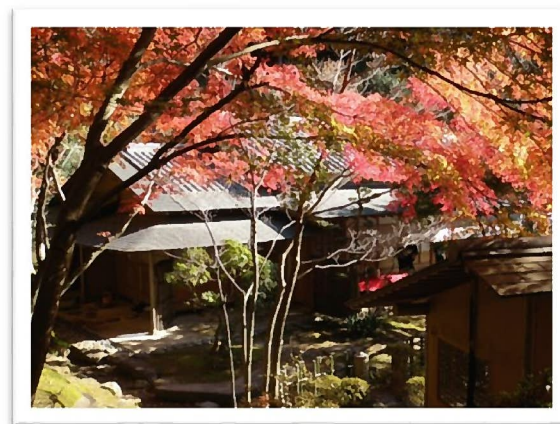
紅葉で赤く染まる應聖寺庭園 (場所/福崎町高岡1912)