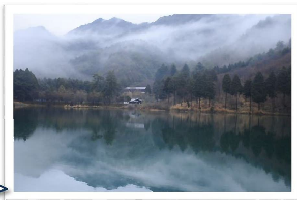
朝霧に包まれた青少年活動センターと田口奥池 (場所/福崎町田口700-1)

秋から冬にかけてのよく晴れた早朝に朝霧が発生することがあり、幻想的な風景を見ることができます。