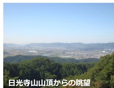
日光寺山山頂からの眺望

日光寺山には、町営バスサルビア号・亀坪停留所横の登山道から登ることができます。登山道は舗装されていて、安全に登ることができます。標高408mの日光寺山山頂からはすばらしい眺めを見ることができます。