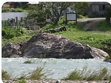
河童伝説の舞台となった胸ヶ岩