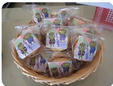
上田菓子舗の素朴なお菓子 「フクちゃんサキちゃん」(130円)