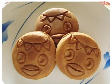
可愛らしいもちもち食感のお菓子 月味庵の「河太郎焼き」(130円)