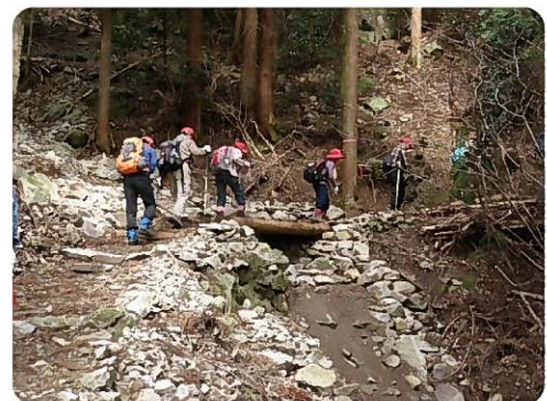
整備された遊歩道