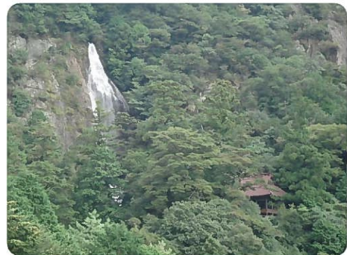
平成の滝見台からみた七種の滝と七種神社