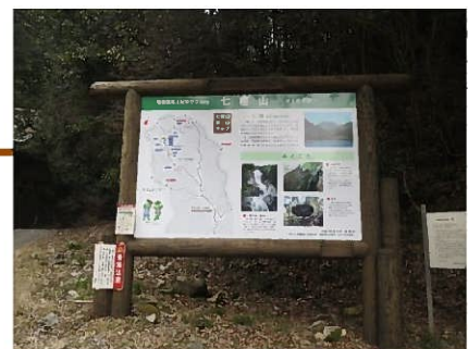
作門寺山門前大看板