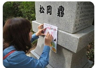
松岡家五兄弟石像フロッタージュ・ラリー